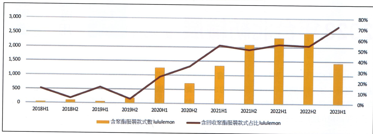
圖 2. Lululemon 採用回收聚酯服飾比例