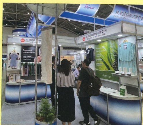
會員廠商攤位實況