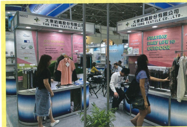
會員廠商攤位實況